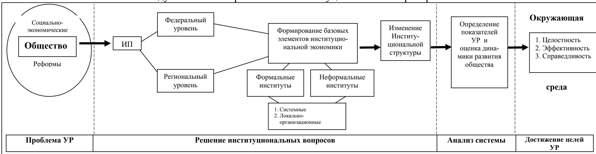
Схема 2. Взаимосвязь между Устойчивым развитием и институциональными преобразованиями.