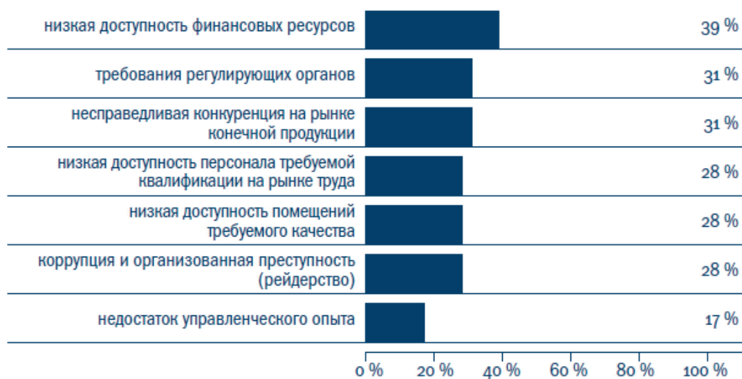
Рис. 2. Наиболее значимые проблемы развития малого бизнеса Иркутской области в 2008г.

ток управленческого опыта как одну из наиболее значимых проблем развития малого бизнеса 5 (рис. 2).